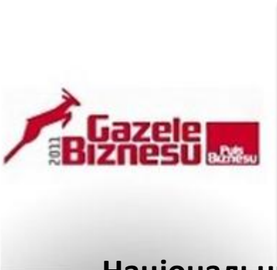
Газель Бізнесу 2011