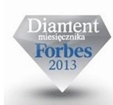
Діамант Forbes 2013