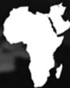
Africa, Near East