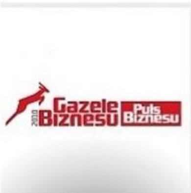
Газель Бізнесу 2010