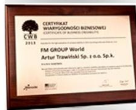
Сертифікат «Довіра в бізнесі»

Національний Чемпіон 2014-2015 Конкурсу European Business Awards