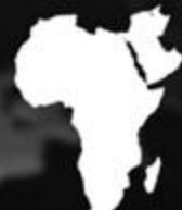
Africa, Near East